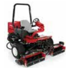
Reelmaster® 3100 Cortacésped de molinete para zonas pequeñas

Elija el cortacésped de molinete cilíndrico Toro Reelmaster perfecto para preparar un césped impecable el día del partido. Todos equipados con molinetes EdgeSeries™.