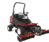
CT2240 Cortacésped de molinete compacto

Encuentre el equipamiento ideal con molinetes cilíndricos para mantener su terreno de juego en perfectas condiciones.