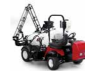
Multi Pro 1750 Fumigador

El Multi Pro 1750 utiliza un avanzado diseño de sistema de fumigación, combinado con controles de fumigador de vanguardia y funciones de vehículo productivas para alcanzar los caudales de fumigación más eficientes, avanzados y precisos.