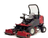
LT-F3000 Desbrozadora triple

Acabado del corte ★★★★★ Compactación del suelo ★★★★★ Recogida de hierba ★★★★★