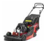
ProStripe® 560 Cortacésped para crear franjas

Seleccione el equipo idóneo para limpiar tras el partido y obtener un atractivo acabado con franjas.