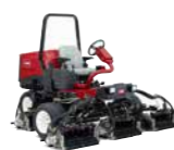
Reelmaster 3555-D/3575-D Cortacésped de molinete para grandes superficies

Acabado del corte ★★★★★ Compactación del suelo ★★★★★ Recogida de hierba ★★★★★