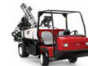
Multi Pro® WM Fumigador

Este sistema de fumigación para vehículos utilitarios de la serie Workman® HD de Toro es el accesorio fumigador montado en plataforma más eficiente y avanzado del mercado, con agitación agresiva y tiempos de respuesta más rápidos.