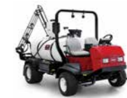
Multi Pro 5800 Fumigador

Todos los aspectos de este sistema de fumigación se han diseñado para ofrecer una precisión inmejorable, una agitación agresiva y un tiempo de respuesta más rápido. Garantiza el caudal de fumigación deseado, incluso en los entornos más exigentes.