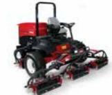
Reelmaster 7000 Cortacésped de molinete de servicio pesado

Acabado del corte ★★★★★ Compactación del suelo ★★★★★ Recogida de hierba ★★★★★