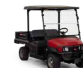
Workman GTX Vehículo utilitario

Un vehículo crossover para terrenos y céspedes que presenta una combinación sin rival de confort, utilidad y control. Su elevada potencia, suspensión exclusiva y sistemas de freno hacen del Workman GTX el vehículo más versátil y práctico.