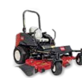
Groundsmaster 7200/7210 Cortacésped rotativo de giro cero

Acabado del corte ★★★★★ Compactación del suelo ★★★★★ Recogida de hierba ★★★★★