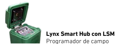
Lynx Smart Hub con LSM Programador de campo

Acceda al sistema en las instalaciones con el sofisticado hardware de campo de Toro.