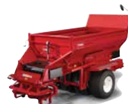
ProPass™ serie 200/ MH-400 Recebedora

Confíe en la afamada flota de vehículos utilitarios de Toro para cualquier tarea en los campos o en los alrededores.