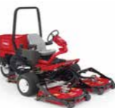
Groundsmaster® 3500-D/3505-D Cortacésped rotativo

¿Quiere competir en la liga superior a un precio asequible? ¿Ha pensado en adquirir un equipo Toro de segunda mano/usado? Eche un vistazo a la página 38 para obtener más detalles.