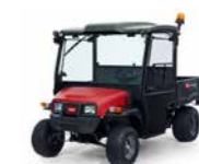
Workman MDX/MDX-D Vehículo utilitario

El trabajo duro no debe empezar hasta que llegue al lugar de la tarea. Pruebe la serie Workman MDX con un estilo de carrocería robusto y con el sistema SRQ™ (Superior Ride Quality), que aumenta la comodidad del operador y la productividad.