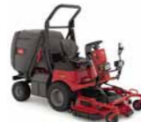
ProLine H800 Cortacésped Direct Collect

Acabado del corte ★★★★★ Compactación del suelo ★★★★★ Recogida de hierba ★★★★★