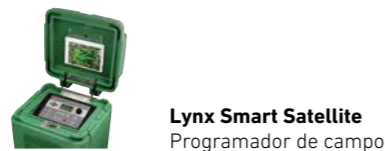
Lynx Smart Satellite Programador de campo

El sistema de control centralizado Lynx añade una comunicación mejorada e integración con los sensores del campo para tomar decisiones más informadas. Además, Lynx Smart Satellite es totalmente compatible con los sistemas Network VP® y Network 8000 como añadido o como sustitución.