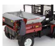
Recebedora 1800/2500 Remolque distribuidor

Si se monta en un Toro Workman (1800) o se remolca con uno (2500), las recebedoras Toro realizan los trabajos más duros y ofrecen un rendimiento productivo y preciso. La tracción a todas las ruedas asegura un caudal de aplicación constante.