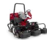
Reelmaster® 3550 Cortacésped de molinete ligero

Acabado del corte ★★★★★ Compactación del suelo ★★★★★ Recogida de hierba ★★★★★