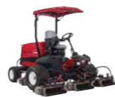
Reelmaster 5010-H Cortacésped de molinete híbrido para grandes superficies

Acabado del corte ★★★★★ Compactación del suelo ★★★★★ Recogida de hierba ★★★★★